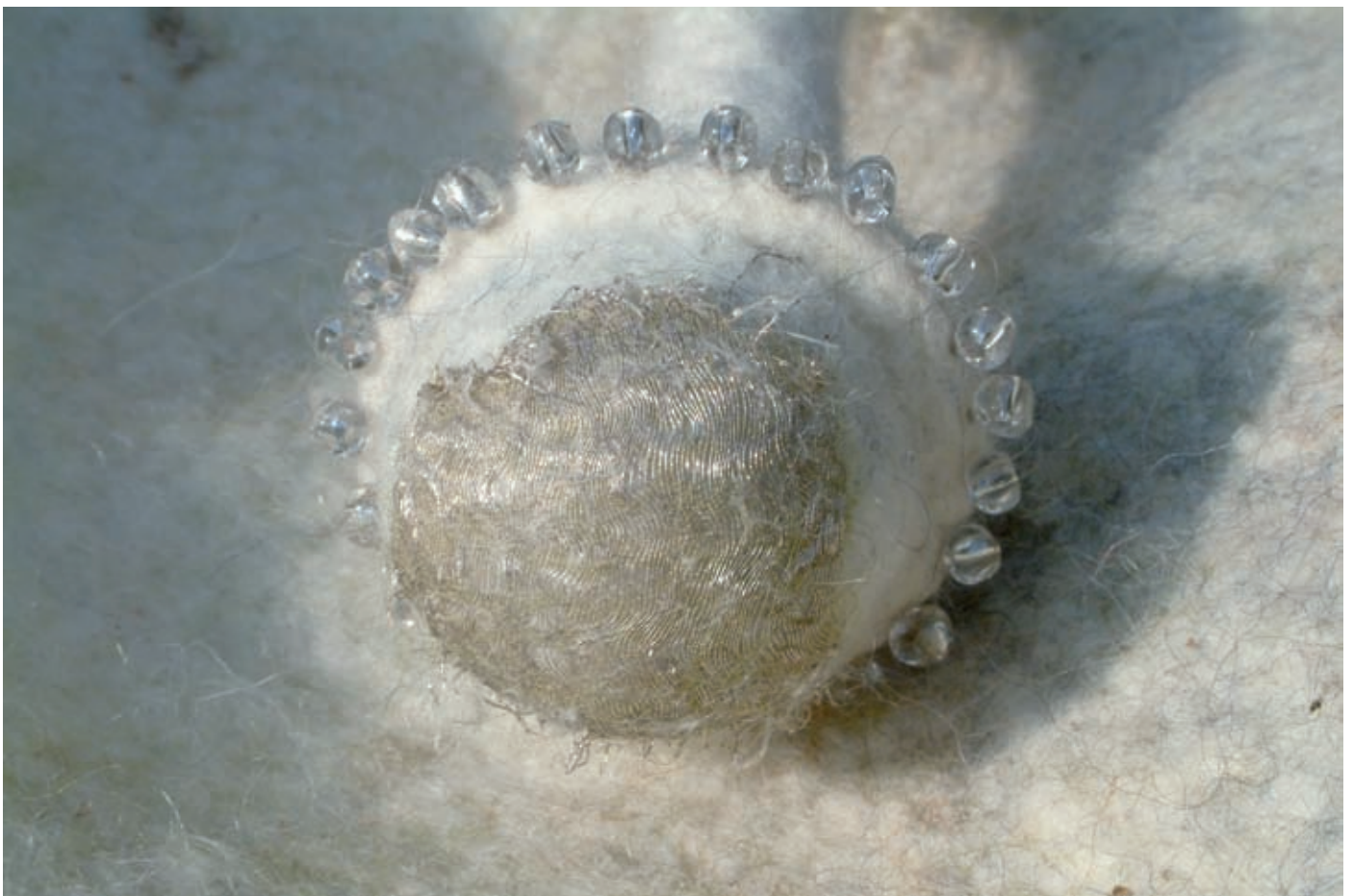
'Secrets Within' (detail), met 'parels' bewerkt uiteinde van een voelspriet.

Tekst: Afke Zwierzina