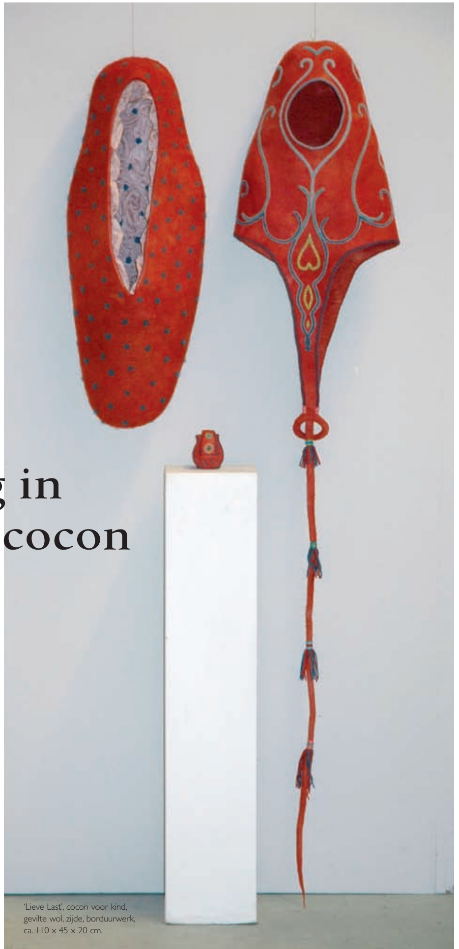
'Lieve Last', cocon voor kind, gevilde wol, zijde, borduurwerk, ca. 110 x 45 x 20 cm.