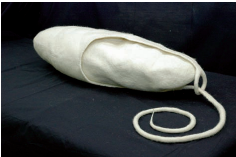
Basiscocon voor een kind, gevilte wol, nog ongeverfd.