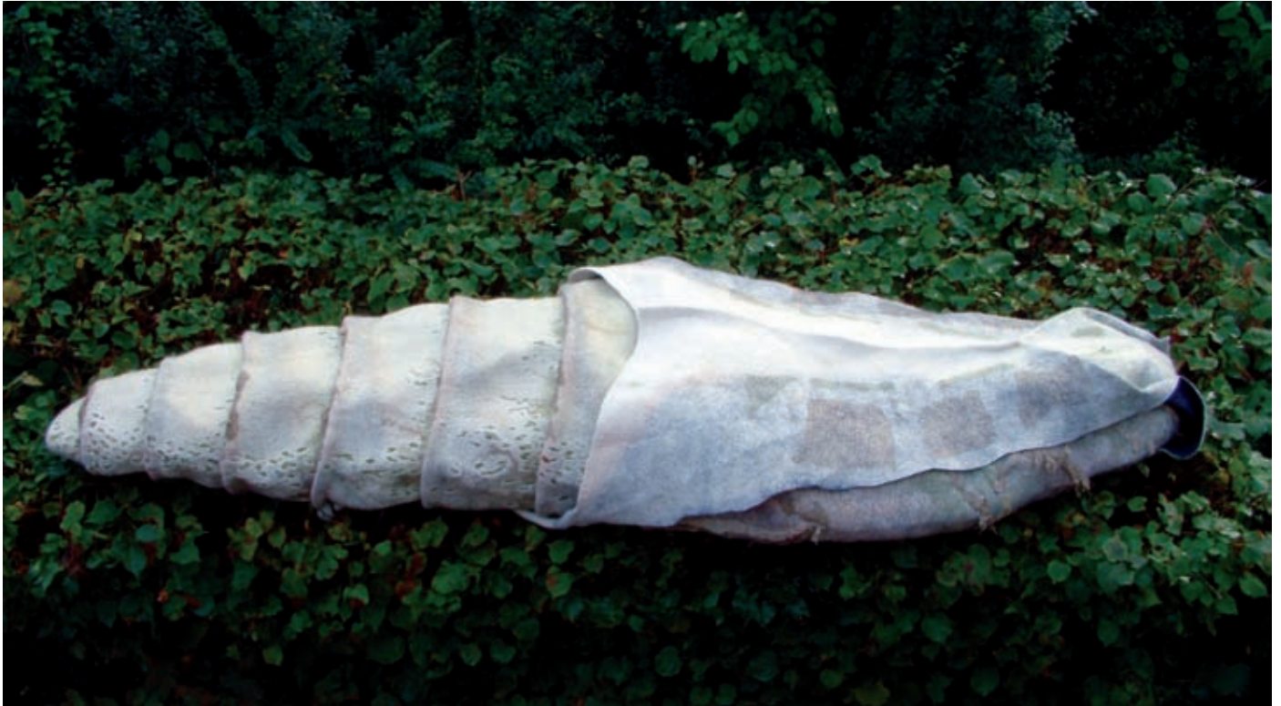
'Secrets Within', cocon voor een volwassene (met aangetaste zijkant), gevilt wol, parels, ca. 200 x 65 x 20 cm.

en kan fungeren als armband, als object of als omhulsel voor een kaarsje.'